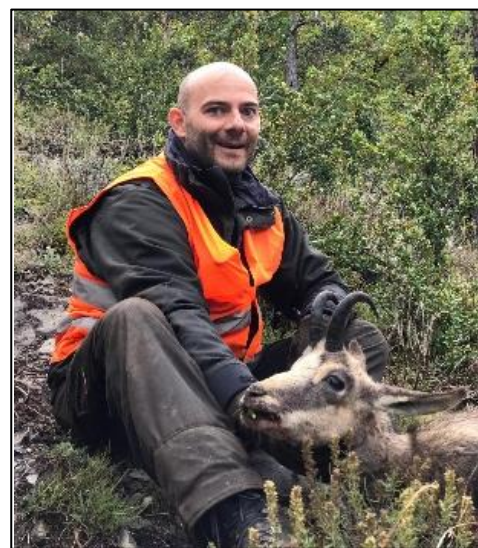
En glad jæger med et fint trofæ